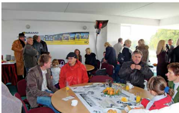
Výzdoba lože naší společnosti připomínala divákům dostihů 120. výročí založení rafinerie v Pardubicích.

Royal Mougins je trojnásobným vítězem Zlatého poháru a nyní již i trojnásobným vítězem Ceny Paramo.