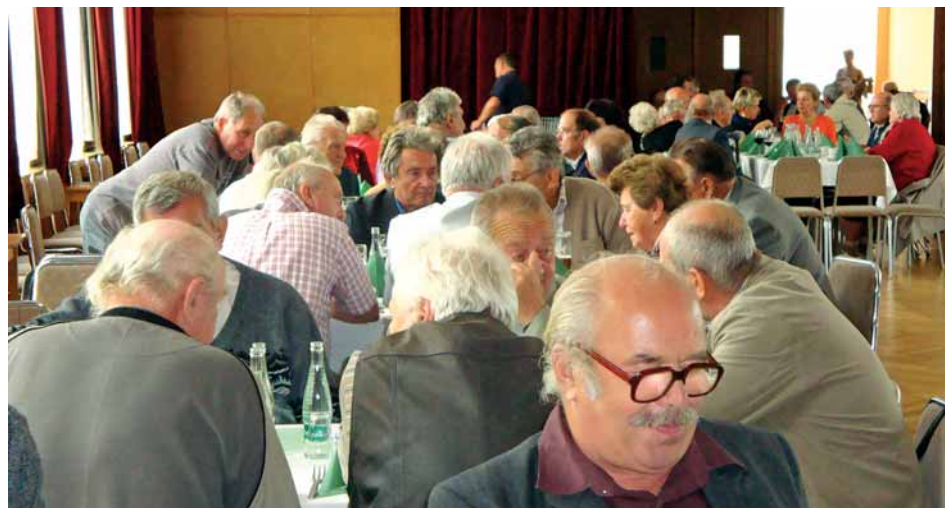
Pozvání na setkání přijala více jak stovka bývalých zaměstnanců, kteří jsou dnes už na zaslouženém odpočinku.

linou a také se podívat na svá bývalá pracoviště v rafinerii. V DK Dukla je v poledne čekal společný oběd a odpoledne jim k poslechu a tanci hrála hudba.