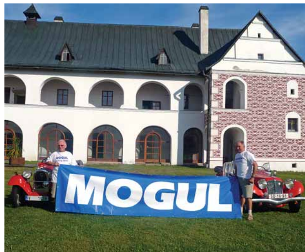
Na akci nechyběla ani naše značka Mogul

Do rodné vsky se vrátil po čtyřiceti letech záměrně. Svě jubileum chtěl oslavit tím, co má rád a přináší mu radost. Do areálu zrenovaného starého zámku se sjela dvacítká automobilových veteránů a spousta motocyklů. Předválečné i poválečné stroje různých značek nebyly vystaveny jen na odívákům, ale ujely i pěkných pár kilometrů se zastávkami na poutním místě Homole, na rozhledně ve Vrbici a skanzenu Krkovic. Vydařil se i neformální společenský večer. Předmětem mnoha diskuzí, taky jak jinak, byla budoucnost veteránských akcí.