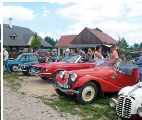
Na sraz do Koldína dorazily nejen aerovky, ale i vzácné sportovní MG z roku 1934, Ford Mustang Cabrio, MG B a mnoho dalších.