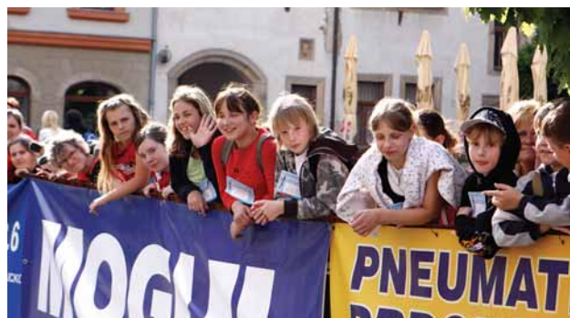
Fanušci lidového běhu na Perštyňském náměstí.