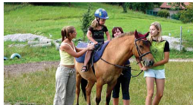
JK Orlová se zabývá hipoterapií zdravotně postižených osob, převážně dětí.