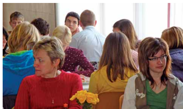
Vyhodnocení soutěže žáků devátých tříd základních škol „Kdo by se bál chemie“, kterou pořádá SPŠCH Pardubice, každoročně probíhá v naší společnosti.

Donátorské aktivity Parama ocenili i pořadatelé 46. ročníku Kmochova Kolína, lidového běhu Pardubická devítka, mezinárodního festivalu šachu a her Czech Open i představitelé sportovního klubu SC Kolín či Hvězda SKP Pardubice. Stejně tak organizátoři chemicko-technologické konference Aprochem a tvůrci dokumentárního filmu Ztracená obec Ležáky.