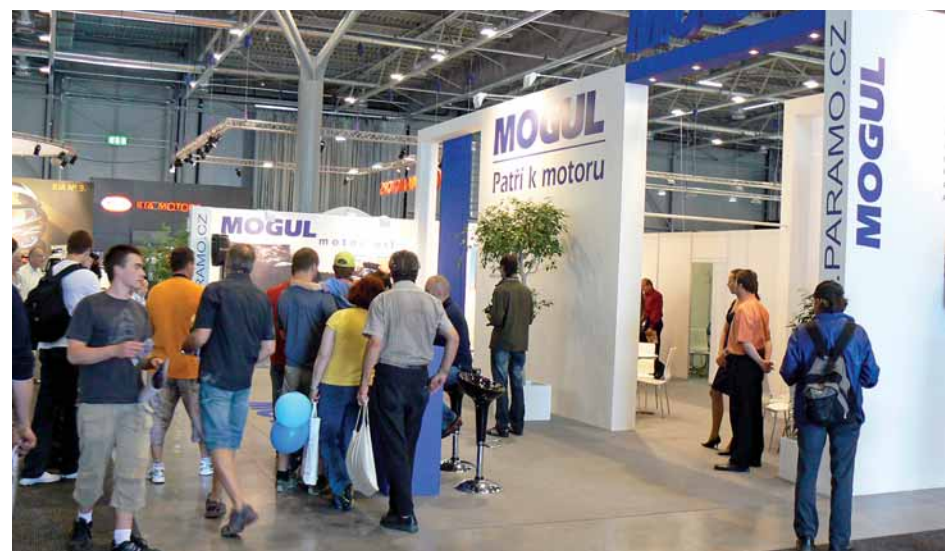
Paramo na Autosalonu informovalo motoristy o svých produktových novinkách a o úspěšném spojení své značky Mogul s motoristickým sportem.