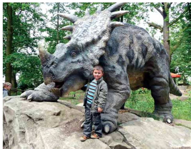
Spoustu nevědných zážitků si odvezly děti našich zaměstnanců z dinoparku a ZOO v Plzni. Výlet pro ně uspořádala ZO OS ECHO Paramo a další plánuje na podzim letošního roku do podobně zajímavé lokality.

zaměstnanec Parama!!! Stačí umístit samolepku Mogul či Mogul Racing Team na soukromý vůz a požádat o totéž i známé. Zvažte tuto možnost a propagujte značku své firmy.