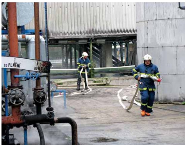
V provozu 03 KAE (kationaktivní asfaltová emulze) se do „akce“ zapojila i bezpečnostní agentura Dora.

Prověřovací cvičení potvrdila profesní schopnosti příslušníků jednotky HZSp Pardubice.