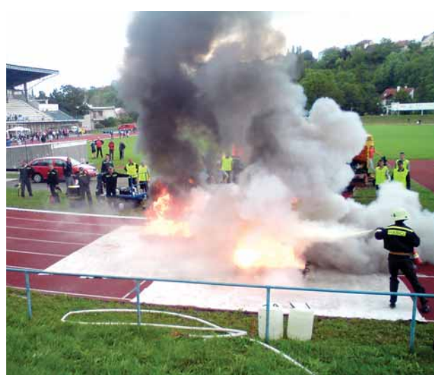
Príslušníci jednotky HZSp úspěšně Paramo reprezentovali v požárním sportu. V celkovém pořadí Pardubického kraje obsadili 6. místo. Na stadionu AFK Chrudim a na požární stanici v Chrudimi své síly měřily jednotky z Pardubického a Královehradeckého kraje.

lo ale jen třináct autorů. Navíc nezůstali jen u jedné myšlenky, ale zaslali jich hned několik. Odbor marketingu bude nyní vybírat z více jak padesáti nápadů ten nejlepší. Jméno jeho autora zveřejníme v zářijovém čísle firemních novin.