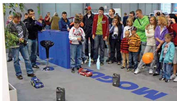
Pro návštěvníky naší expozice byly připraveny různé soutěže o ceny.