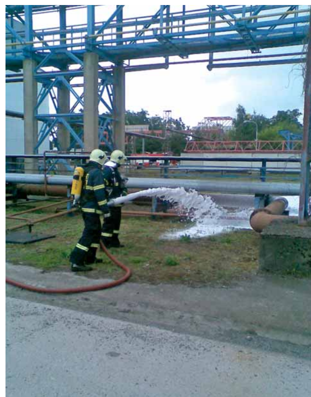
Odborné schopnosti prokázali příslušníci podnikové jednotky i v prvním provozu.

„Příslušníci jednotky se v průběhu cvičení seznamují s jednotlivými provozy, jejich technologiemi, vhodným nasazení