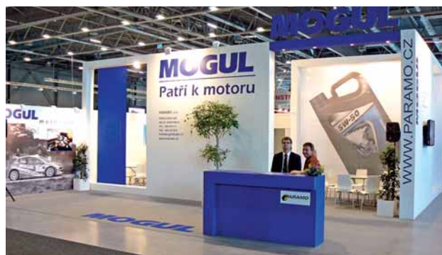
Naše rafinerie na letošním automobilovém veletrhu vystavovala v nově vybudovaném pavilonu P.