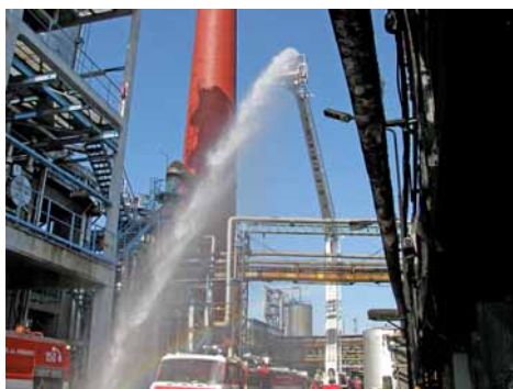
Na provoz AVDR byla při cvičení hasičů povolána také výšková technika.