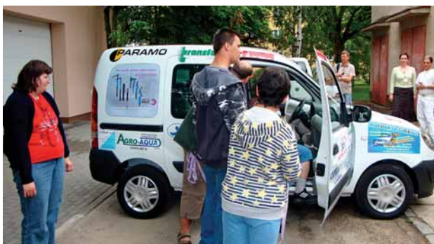
Klienti Slunečnice měli z nového vozu velkou radost.

Tolik potřebný vůz Renault Kango se podařilo zajistit za spoluúčasti