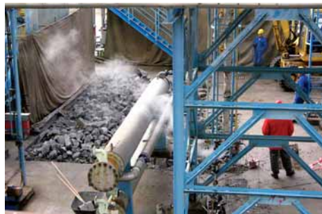
Bourání stávající betonové desky.

Ustavení nádrže předcházela celá řada náročných činností, jak dokumentují snímky vedoucího HOSD Jiřího Kučery.