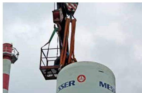
Uvolnění úvazů nádrže.