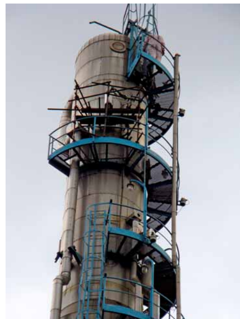
Na koloně vakuové destilace mazutu byly v průběhu provozní zarážky otevřeny průřezy, kontrolována a čištěna patra a šesté patro bylo zcela vyměněno.