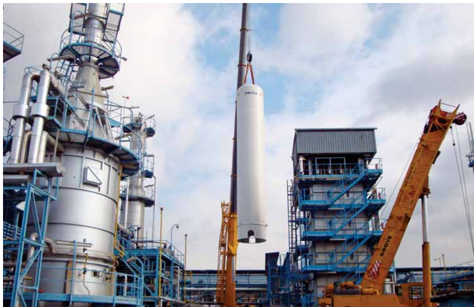
Nádrž na vodík vznesl do výše jeřáb v úterý 10. března dopoledne, aby mohla být postavena na připravené místo jednotky HOSD.