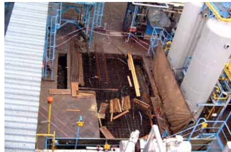
Základová jáma s armováním.