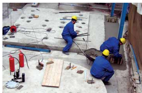
Dokončení betonáže základů.