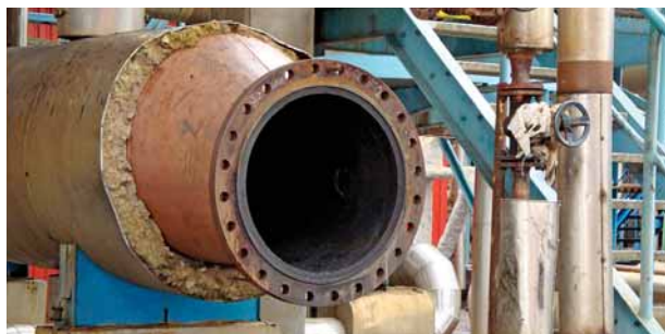
Za účelem čištění byly demontovány desítky výměníků jako například tento na středisku SPB.